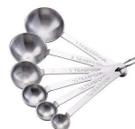
Cuillères à mesure en inox