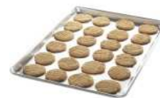
Grande plaque de cuisson