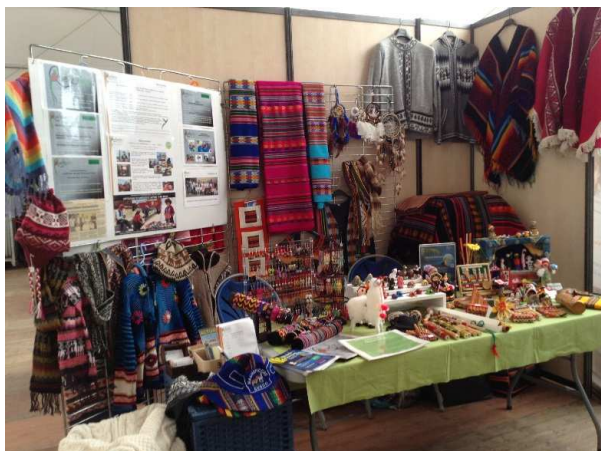
Un artisanat de qualité...