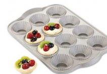
Moule à tartelettes