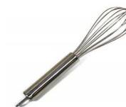
Fouet en inox