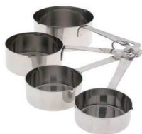
Verres doseurs inox