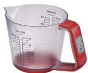
Balance électronique avec verre doseur