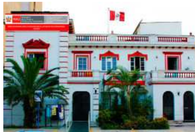
CONADIS Av. Arequipa 375 Santa Beatriz Lima