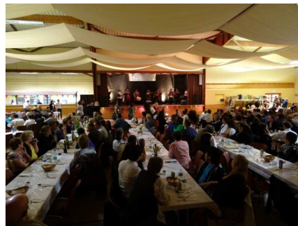
Des soirées thématiques et festives...