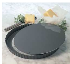
Moule amovible pour quiches