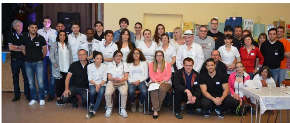
Une équipe motivée