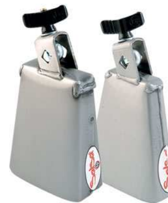
Cloche à main