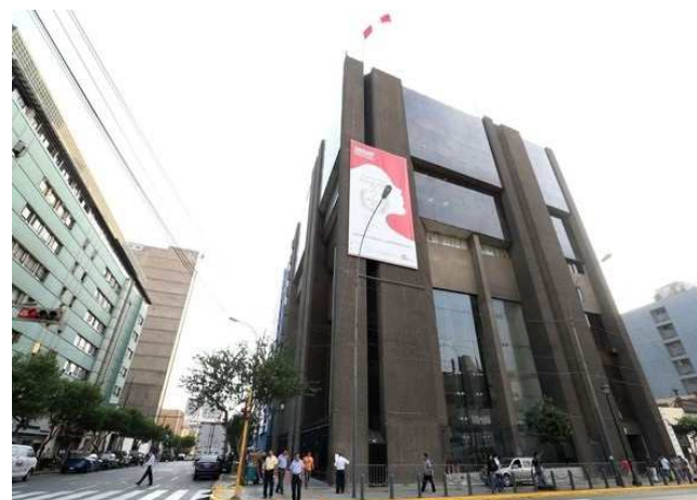
MINDES Av. Camaná 616 Lima