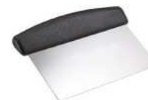
Spatule en inox