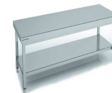
Table de travail inox 2 x 1 m