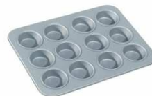
Moule à muffins