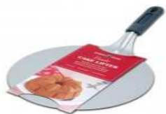
Spatule à gâteau