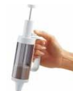
Douille à pâtisserie