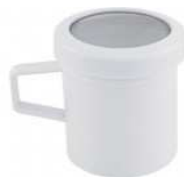
Saupoudrier à maille