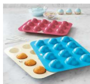
Moule à cake pops