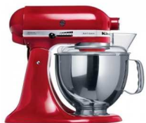
Batteur Kitchen Aid Artisan