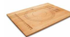
Planche à pâtisserie en bois